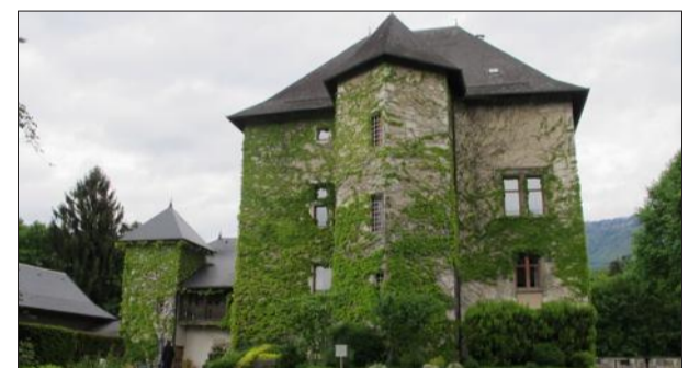
Eurogroup a repris le château de Candie. Il compte investir un million d'euros dans la création d'un centre de bien-être.

Situé au cœur d'un parc de six hectares, dominant la ville de Chambéry, le château de Candie date du XIV e siècle.