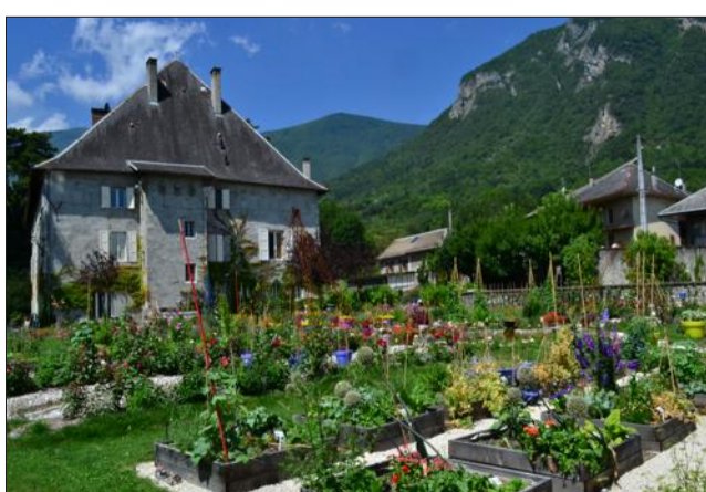
Le potager a été récompensé en 2011 par le premier prix de la Société nationale d'horticulture.

Le château est aussi réputé pour son potager bio. Le jardin a été remanié en 2011 en 88 carrés. Il a été récompensé par un premier prix de la Société nationale d'horticulture de France. Il abrite plus de 150 légumes, fleurs, aromatiques et fruits qui alimentent la table d'hôtes. Des stages de jardinage sont même proposés aux clients.