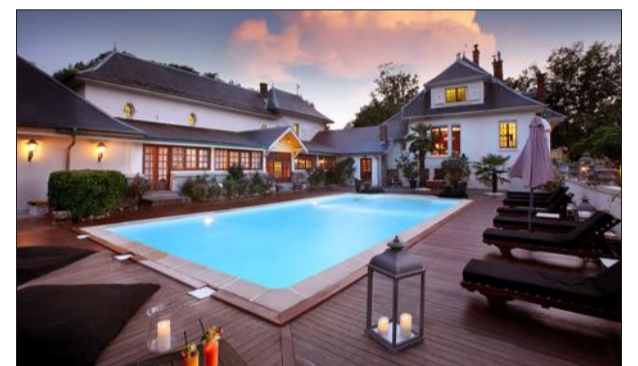
La maison de maître dispose aussi d'une piscine et d'une grande cave à vins.

Le domaine des Saints-Pères, c'est le "bébé" d'Éric Tournier, un hôtelier de Courchevel. L'an dernier, il a rénové entièrement sa demeure en hôtel-restaurant.