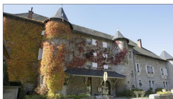
L'imposante demeure challésienne est un des plus anciens hôtels-restaurants aménagés à l'intérieur d'un château en France.