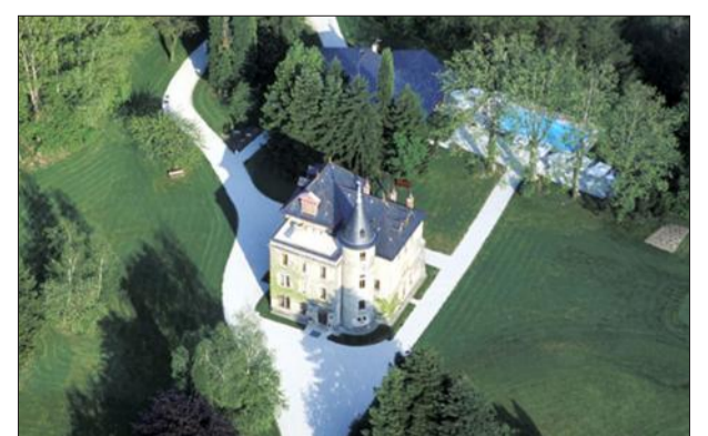
La demeure est entourée d'un parc de sept hectares.

Raymond Prévot, 68 ans, est à la tête du château de la Tour du puits, à Coise-Saint-Jean-Pied-Gauthier, depuis 1994. Rebâti au XVIII e siècle et niché au cœur d'un parc de sept hectares, ce domaine